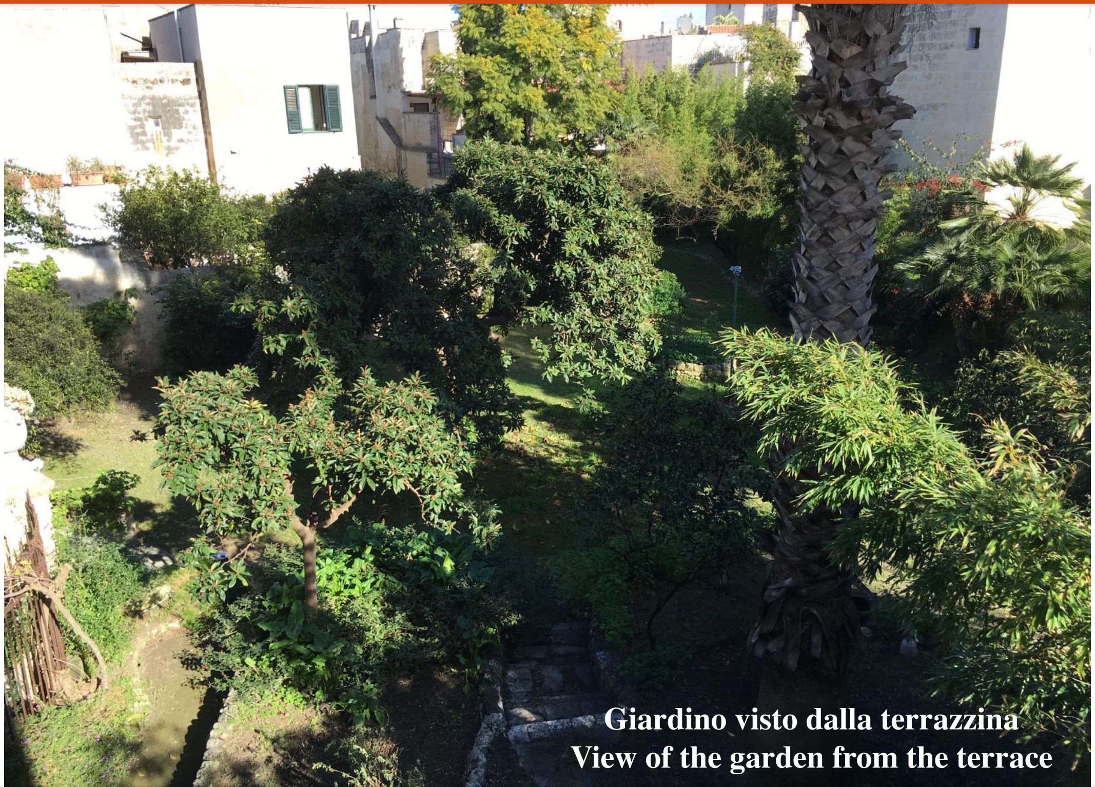
Giardino visto dalla terrazza View of the garden from the terrace