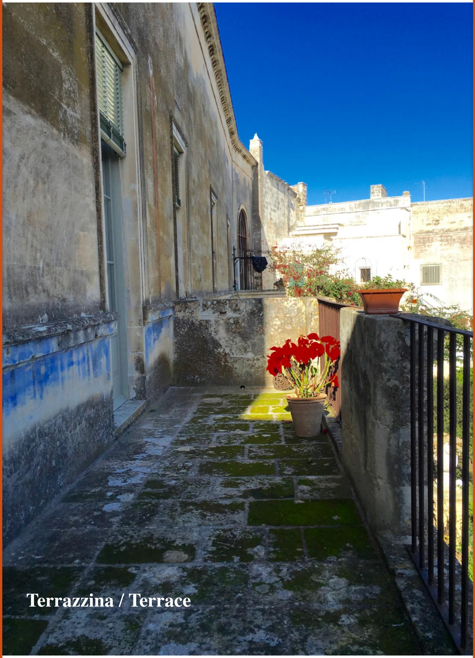
Terrazzina / Terrace