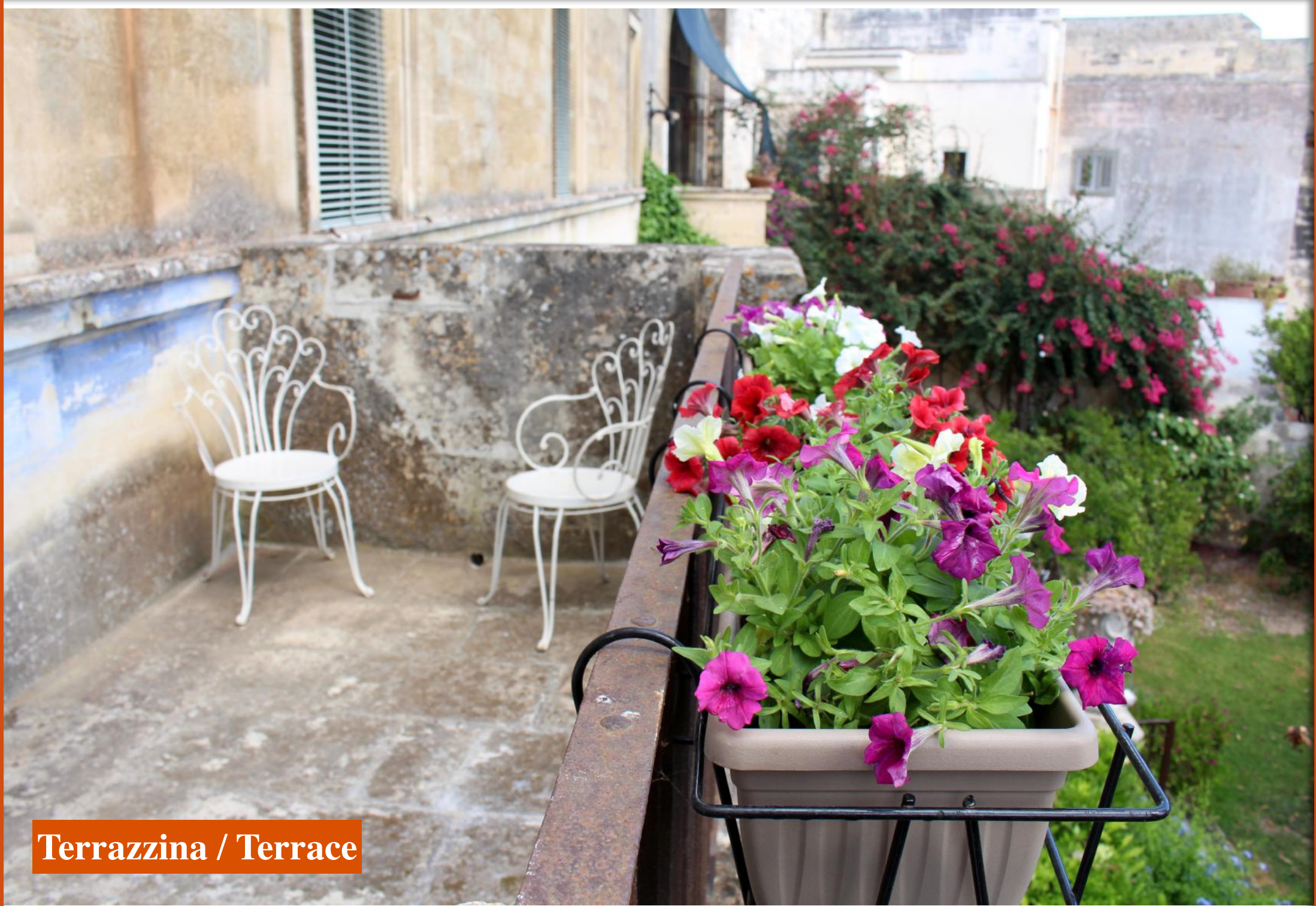
Terrazzina / Terrace